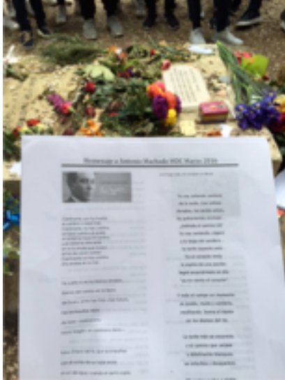
Lectura de poemes a la tomba d'António Machado