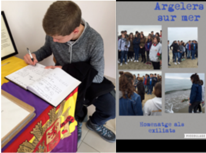
Signatura del llibre de visitants i homenatge als exiliats a la Platja d'Argelers